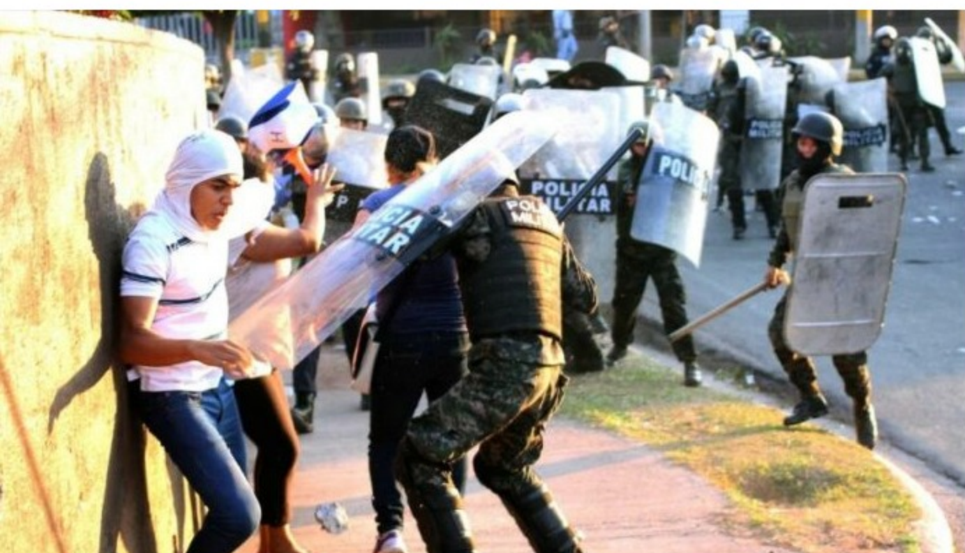
Imagen de referencia. Policías militares deteniendo a manifestantes en Honduras.

TEGUCIGALPA, HONDURAS. Tras el anuncio del Gobierno de militarizar el país ante el paro de «rifles caídos», varias organizaciones se han pronunciado ante este acontecimiento.