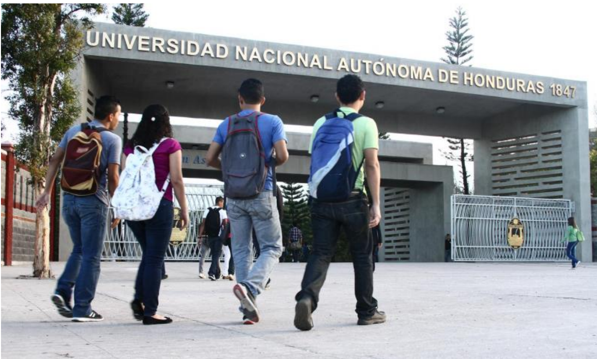
La Oficina del

Alto Comisionado de las Naciones Unidas en Honduras, (OACNUDH) manifestó su preocupación y alarma por la condena de los tres estudiantes de la UNAH.