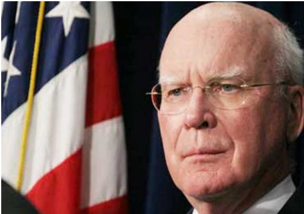
El senador de Estados Unidos, Patrick Leahy.