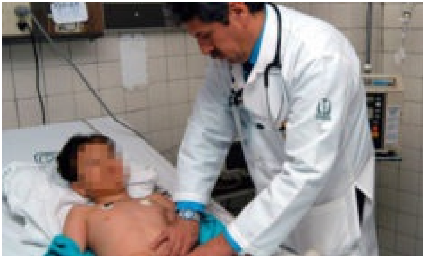
El Materno Infantil atiende a 4 pacientes al día con hepatitis