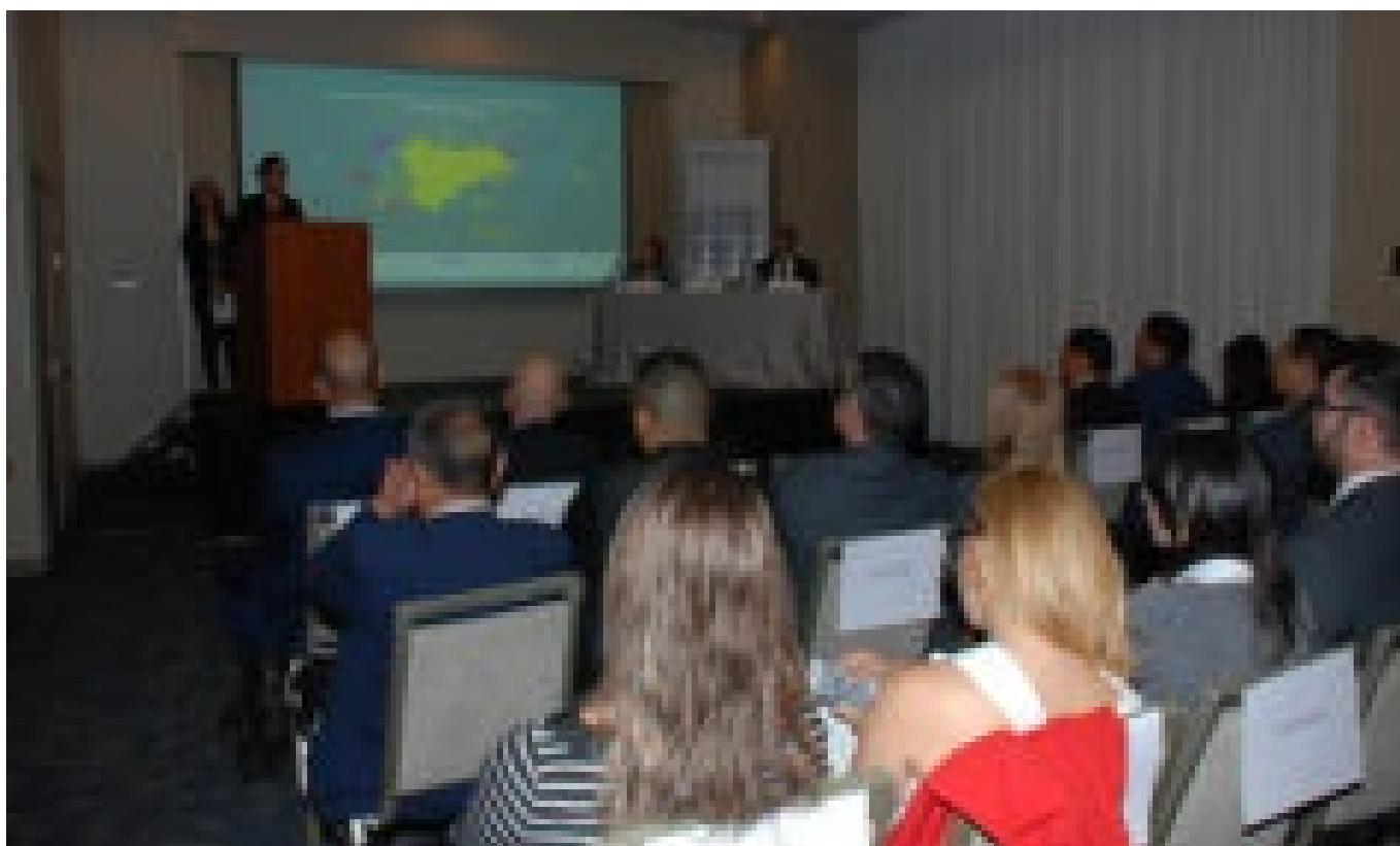
Presentan estudio sobre DD HH en el Triángulo Norte