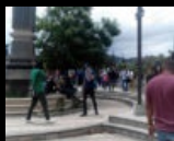
Estudiantes encapuchados son "gaseados" frente a la UNAH (Video)