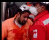
Hieren a camarógrafo de LA TRIBUNA y es atendido por el MEU (Video)