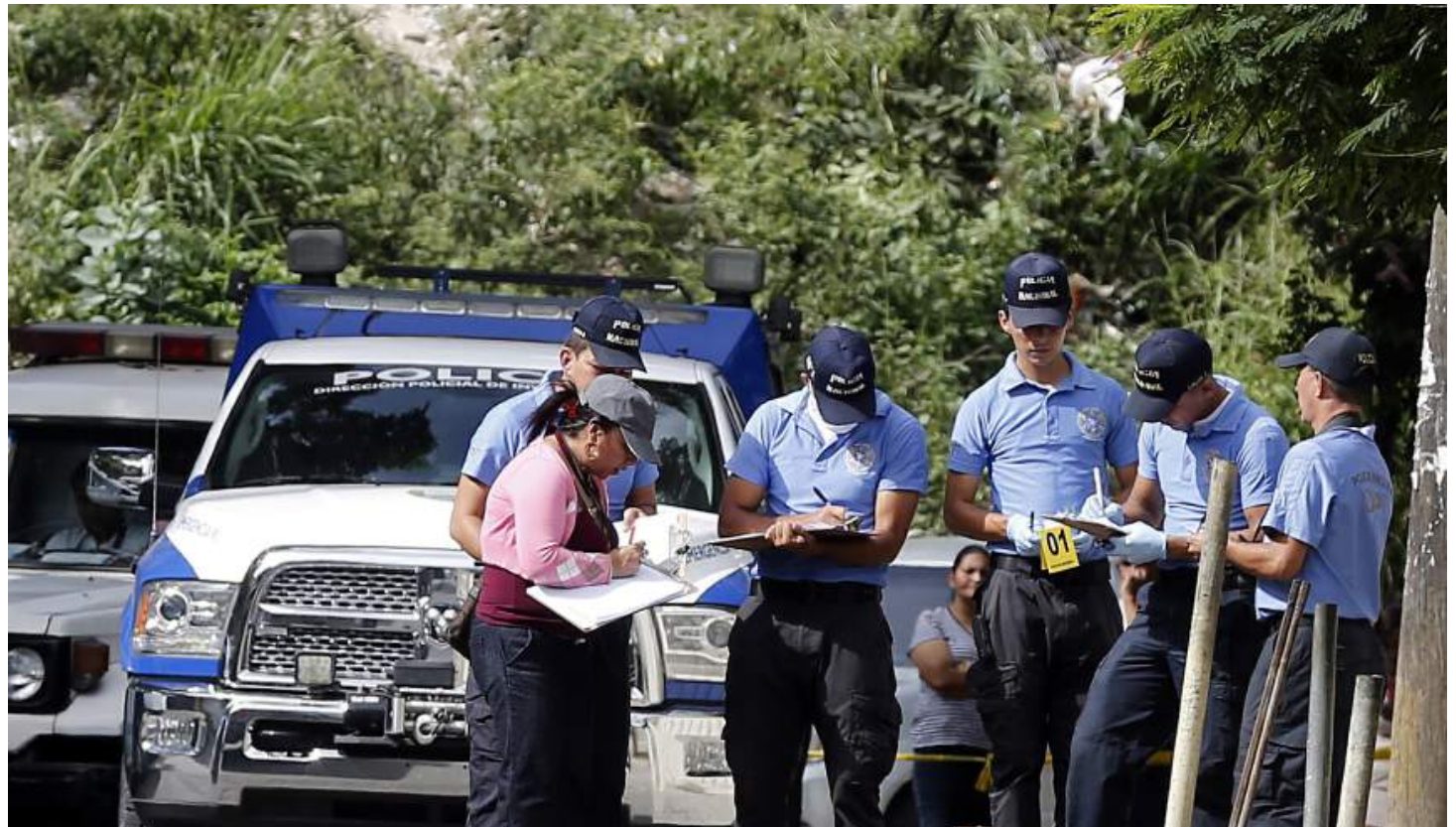
La ONU recomienda a Honduras emprender 'actuaciones urgentes e identificar medidas concretas' para proteger a los desplazados internos por la violencia.