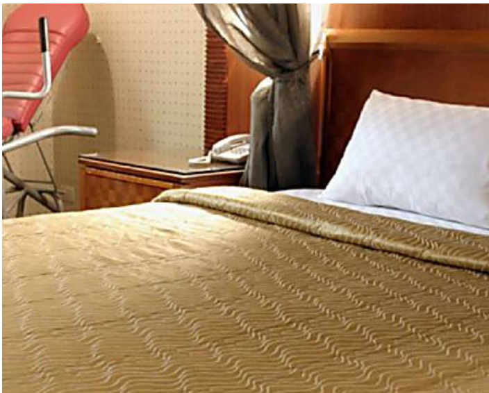
Secretos 'sucios' de cadena de hoteles 3 estrellas