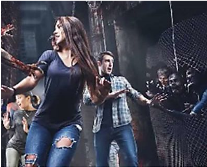
The Walking Dead Attraction: así será el terrorífico paseo