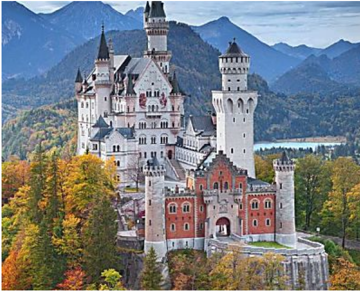
Lugares como sacados de cuentos de hadas para hacer turismo