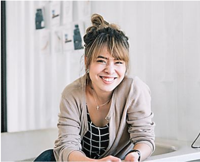
7 trucos para aprender francés en este 2017 y en solo 7 días Babbel