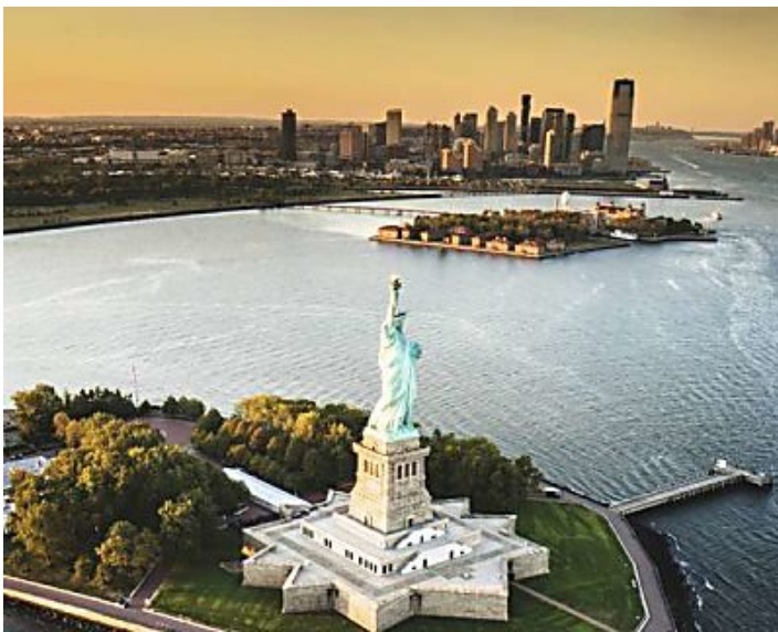
Estatua de la Libertad: cosas que no sabías del atractivo turístico