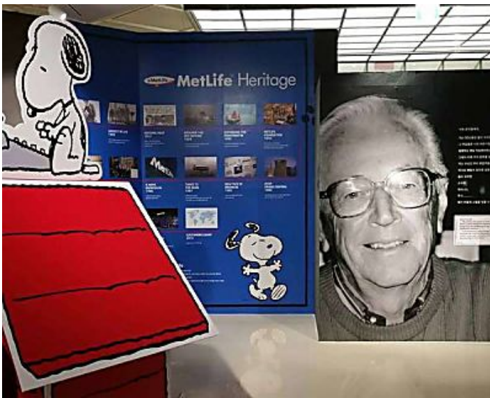
Si te gusta 'Snoopy' vas a querer ir al Museo Schulz