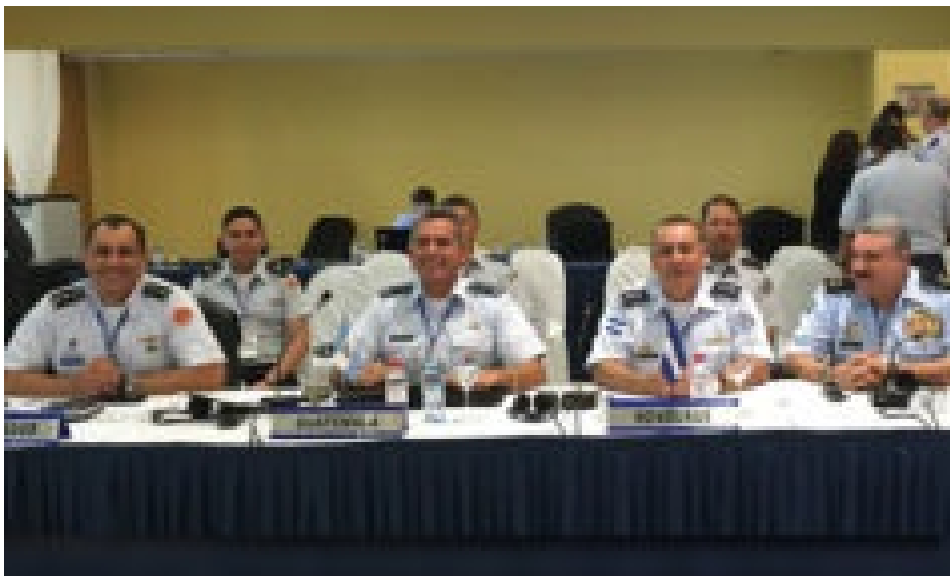
Fuerzas aéreas de América se reúnen en Brasil