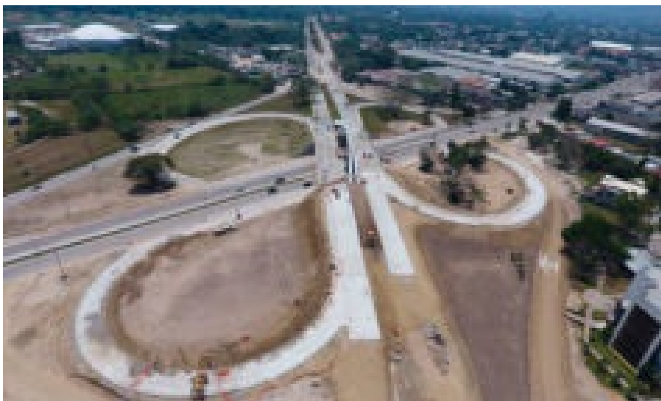
Intercambio de Gala en SPS estará terminado en el tercer trimestre del 2017