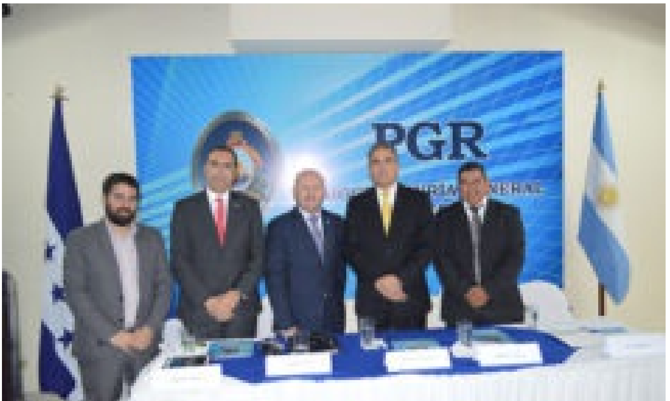
La PGR y la Cancillería de Argentina suscriben convenio de cooperación