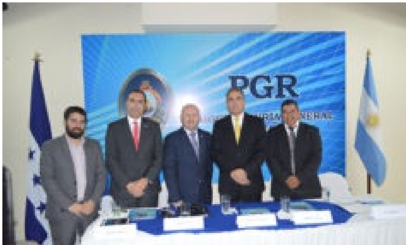
La PGR y la Cancillería de Argentina suscriben convenio de cooperación