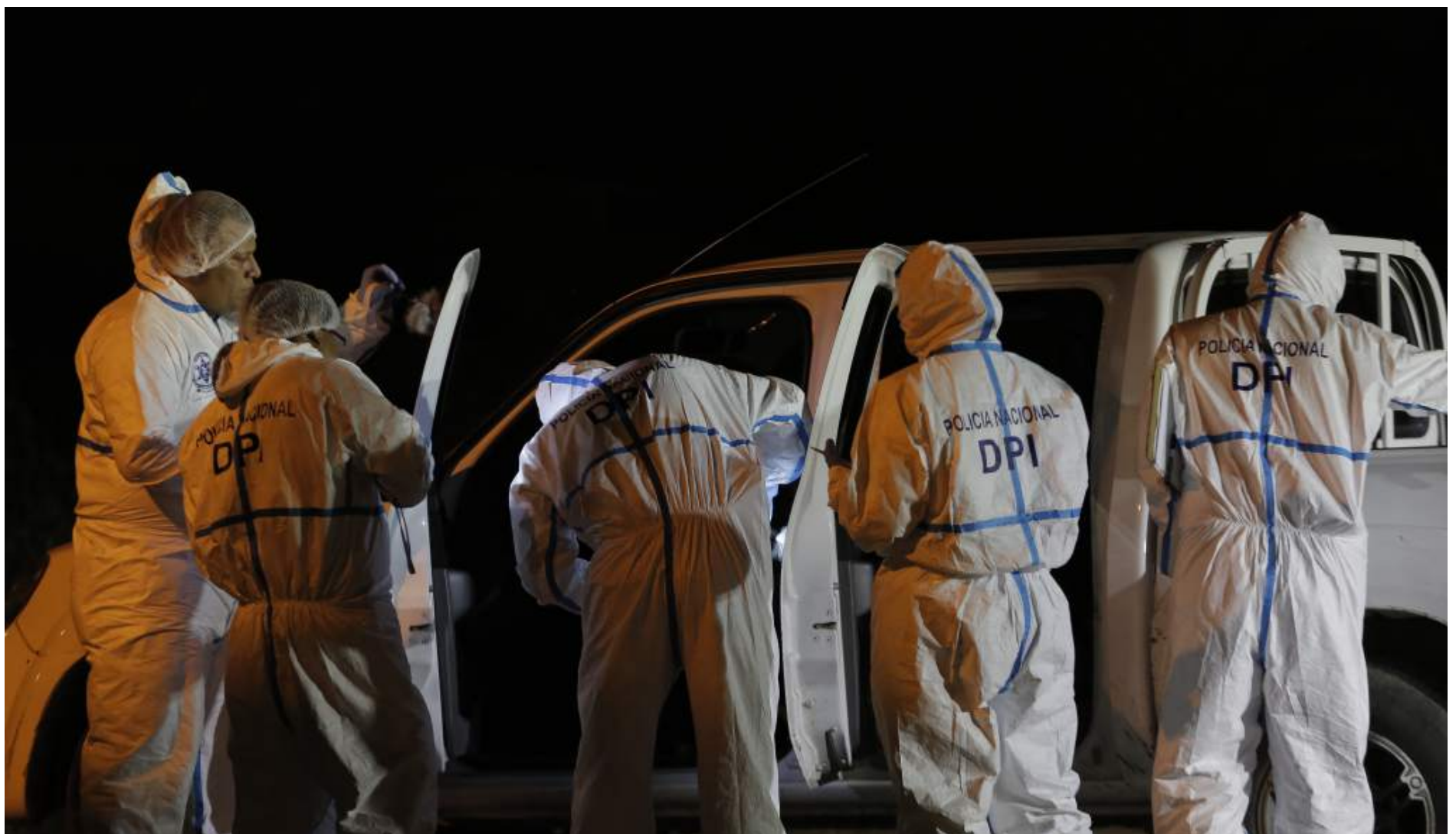
Agentes de la DPI durante la inspección a un carro abandonado en San Pedro Sula, el cual podría estar relacionado con el crimen del periodista Igor Padilla.