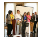
Junta Interventora a la UNA