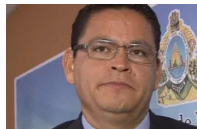
Secretario De Educación De Honduras Renuncia... ¡Por Twit!