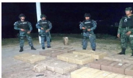
Militares Recogen Del Mar Unos 700 Kilos De Supuesta Droga