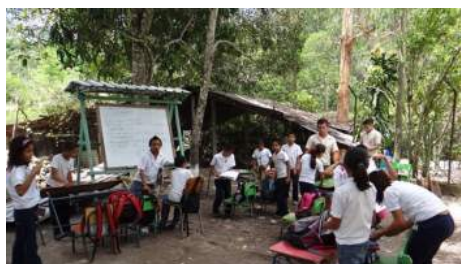
Advierten Que Con O Sin Escoto No Habrá Mejora En El Sistema Educativo