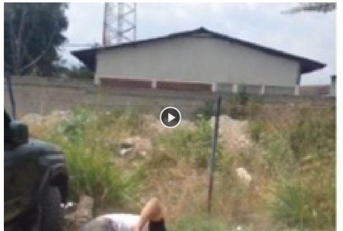
Siguen las "trompadas" entre supuestos estudiantes de Universidad Católica