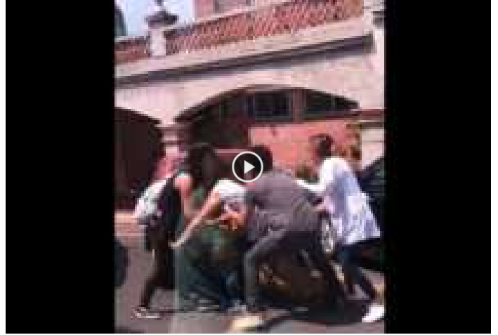
"Pleito de faldas" fue la pelea de supuestos estudiantes en la...