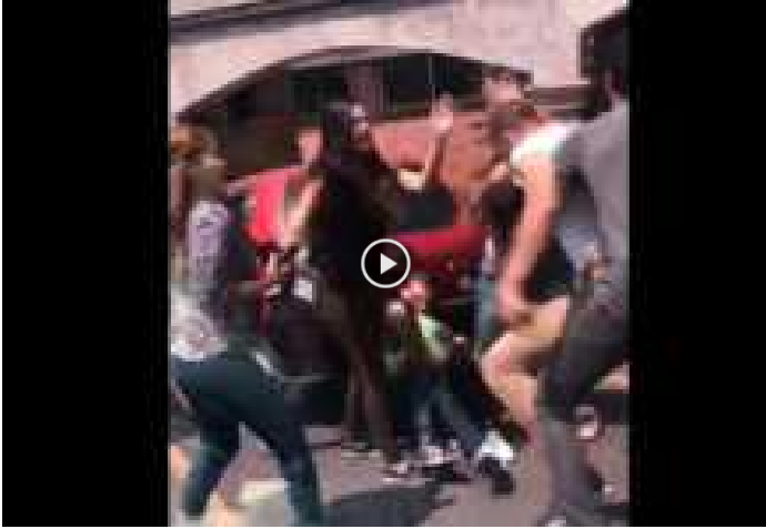
VIDEO | Supuestos estudiantes protagonizan "batalla" en la Universidad Católica