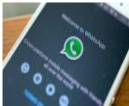
APLICACIÓN Poseídas por mensaje en WhatsApp