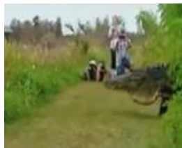
GODZILLA Gigantesco caimán sorprende