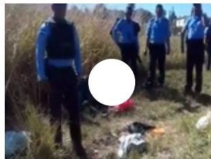
Policía se enfrenta a disparos con delincuentes en colonia América