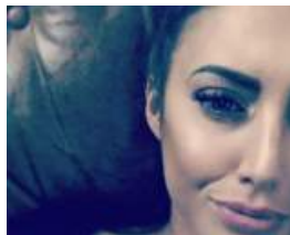
REDES Mensaje de mujer a punto de morir