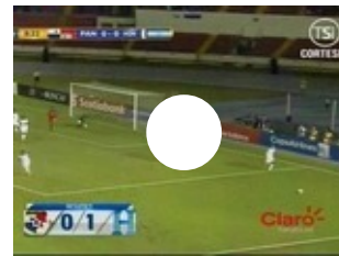
La H casi campeón de la Copa Centroamericana al vencer a Panamá