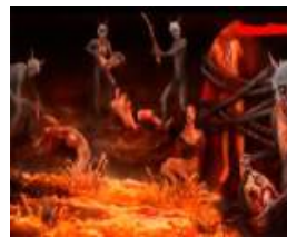
CIENTÍFICOS RUSOS Descubren las "voces del infierno"