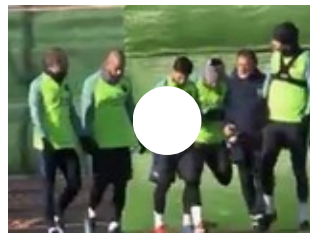
Así se divierten jugadores del Barça previo al duelo ante la Real Sociedad