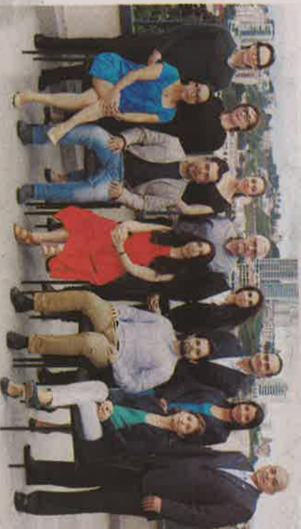
Este es el equipo de la Oficina del Alto Comisionado de las Naciones Unidas para los Derechos Humanos en Honduras.

Además, para el involucramiento de todos los hondureños, la OAC-